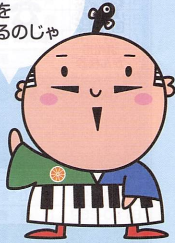
出世大名 家康くん