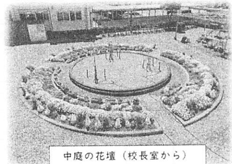
中庭の花壇（校長室から）