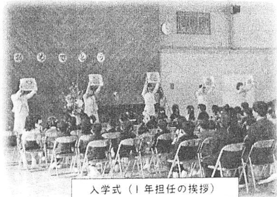
入学式（1年担任の挨拶）