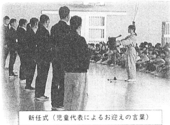
新任式（児童代表によるお迎えの言葉）